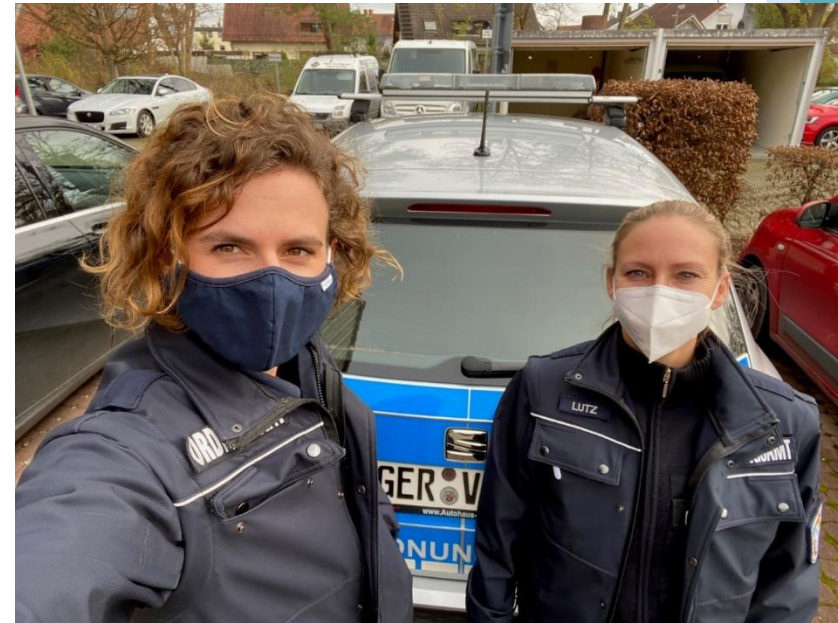
Unsere Mitarbeiterinnen des Ordnungsamts im Einsatz!