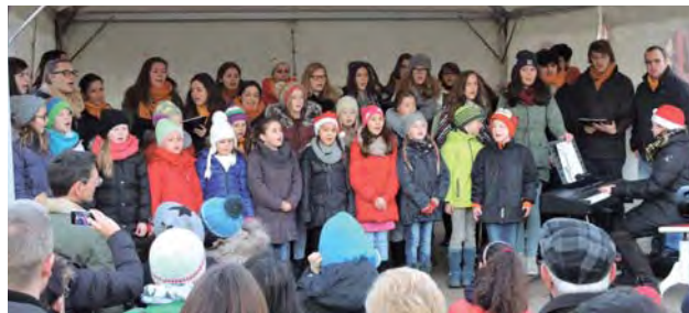
Die Jockgrimer Kinder- und Jugendchöre „Froschkönige“ und „007 – mit der Lizenz zum Singen“

Am zweiten Adventswochenende war der Knuspermarkt wieder ein Anziehungspunkt für zahlreiche Besucher von nah und fern. Zum 25. Mal konnten man sich an über 70 Ständen im und um das Bürgerhaus und Ziegeleimuseum an leckeren Köstlichkeiten erfreuen und so manches liebevoll hergestellte Weihnachtsgeschenk erstehen. Auf der Knuspermarktbühne erschallten weihnachtliche Klänge des Musikvereins und der Kinder- und Jugendchöre „Froschkönige“, „007 – mit der Lizenz zum Singen“ und „Voices of Joy“.