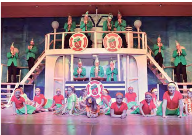
Der Elferrat hatte das närrische Ruder fest im Griff

Die Jockgrimer Fasenacht hatte den großen und kleinen Narren wieder viel zu bieten: Das vergnügliche Kreuzfahrtschiff ankerte in der Südpfalz! Die Besucher der drei Büttensabende erlebten einen kurzweiligen Abend mit viel Spaß und mitreißenden Programmpunkten. Unter dem diesjährigen Motto „Ahoi, helau, das Ruder im Griff, närrisch' Gedees uff'm Kreuzfahrtschiff“ entführten die Jockgrimer Fasenachter das begeisterte Publikum auf die Meere und an die Strände dieser Welt. Alle Gruppen des Balletts, TSG-Turner, Büttensredner und die musikalischen Gruppen boten beste Unterhaltung. Die beiden Faschingsbälle fanden wieder in der TSG Turnhall' statt und luden die Narren am Schmutzigen Donnerstag sowie am Rosenmontag ein, das Tanzbein zu schwingen. Auch die jüngsten Fasenachter kamen auf ihre Kosten: am Faschingssonntag legte DJ Bebbo auf und brachte die TSG Turnhall' zum Beben.