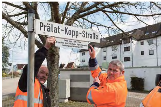
Mitarbeiter der Ortsgemeinde bringen die Zusatzschilder an