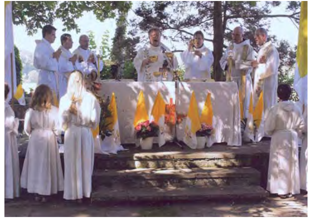
Gottesdienst zum Kirchfest am Schweinheimer Kirchel

zwei Mitgliedern aus jeder der vier Gemeinden, verwaltet das Vermögen der neuen Pfarrei und gleichzeitig auch das der jeweiligen Gemeinde. Die bisherigen vier Kirchenstiftungen mit ihrem Vermögen bleiben bestehen.