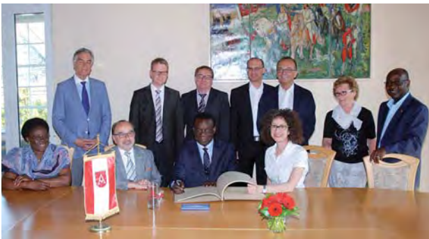
Der Botschafter beim Eintrag ins goldene Buch der Gemeinde