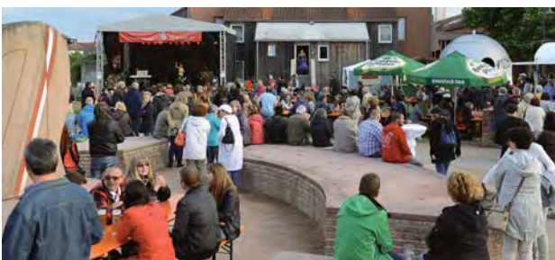
„Jockgrimer MitSommer – MitMusik“

„Jockgrimer MitSommer – MitMusik“ war das große Musikwochenende im Jockgrimer Jubiläumsjahr überschrieben. Jockgrim zeigte sich an drei Tagen von seiner musikalischen Seite mit einem prall gefüllten abwechslungsreichen Programm. Rund ums Bürgerhaus drehte sich alles um die Musik mit ihren vielen Facetten. Auf drei Bühnen boten große und kleine Musiker und Sänger ein abwechslungsreiches Programm, und im Bürgerhaus wurden verschiedene Workshops für jedermann angeboten, deren beeindruckende Ergebnisse am Sonntag zu hören waren. Vereine und Gewerbetreibende boten eine leckere Vielfalt an Speisen und Getränken an und boten beste Voraussetzungen, um Jockgrims Geburtstag zu feiern und gemeinsam ein paar schöne Stunden zu verbringen.