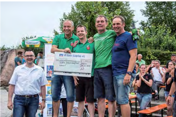
Team „Elferrat 1“