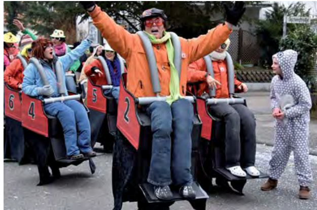
Das Team Brasil auf rasanter Achterbahnfahrt

Jede Menge Spaß hatten die Umzugsteilnehmer und die zahlreichen Zuschauer beim närrischen Umzug am Fastnachtsdienstag. Gut gelaunte Narren jeden Alters feierten gemeinsam eine fröhliche, ausgelassene Straßenparty. Mit fast 30 Umzugsnummern hatten sich die Aktiven wieder viel Mühe gegeben und mit Fantasie und Schaffenskraft für einen krönenden Abschluss der Kampagne gesorgt.