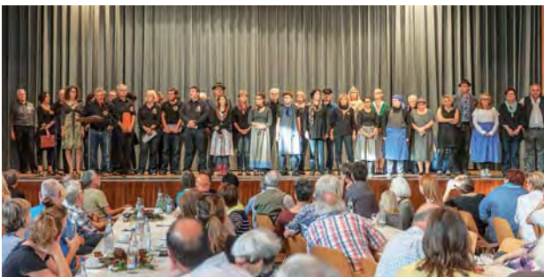
Öffentliche Vorstellung des Theaterprojekts