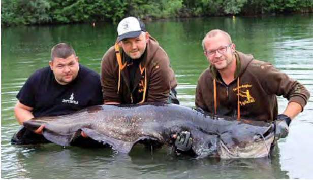
Ein fetter Fang beim Welsangeln

Nach dem „Ansurfen“ im Mai veranstaltete der Surf- & Segelclub einen Schnuppertag auf dem Vereinsgelände am und im Jockgrimer Baggersee. Den interessierten Teilnehmern wurde an Land und im Wasser der Surfsport mit viel Spaß schmackhaft gemacht.