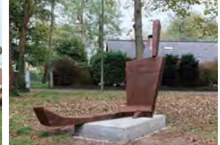
Großer Mann, sitzend