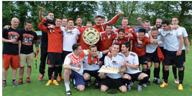
So sehen Sieger aus...

Die zahlreichen Fans der ersten Mannschaft der TSG wurden für ihre Treue belohnt: Nach dem spannenden Spiel gegen den FSV Freimersheim kehrten die Jockgrimer Fußballer nach 20 Jahren endlich wieder in die Bezirksliga zurück. Mit einem Autokorso ging es zurück ins Heimatdorf, wo die Spieler ausgelassen bis in die frühen Morgenstunden feierten.