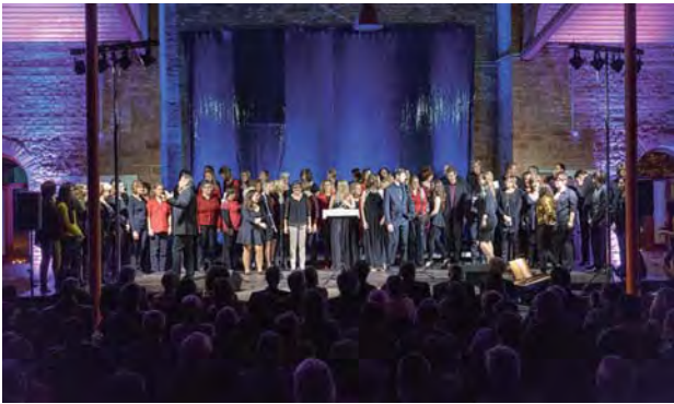
Drei Chöre beim gemeinsamen Abschlusslied