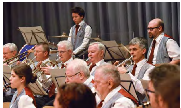
Der Musikverein begeistert sein Publikum