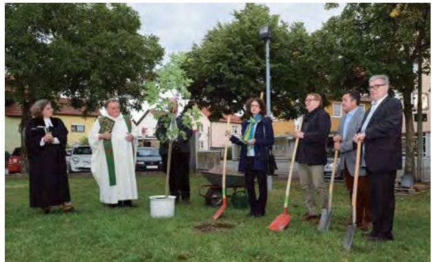
Baumpflanzaktion zum Jubiläumsjahr

Einen Tag später luden die katholische Pfarrgemeinde und die protestantische Kirchengemeinde zum ökumenischen Gottesdienst zum Thema „Schöpfung bewahren“ ein. Der Chor AmiCanta gestaltete den Gottesdienst musikalisch. Im Anschluss pflanzten alle zusammen auf dem Gelände des Rathauses einen Baum und trafen sich dann zu einem gemütlichen Beisammensein. Der Tulpenbaum soll an das besondere Jahr des Ortsjubiläums erinnern.