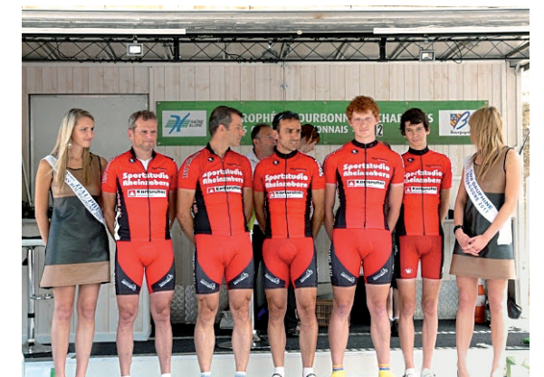
„Mannschaft des TSV Radsport in Burgund“

Die aktiven Rennfahrer waren seit März bei Rennen auf der Straße und im Gelände unterwegs. Dabei gab es wieder über 40 Platzierungen und mehrere Podestplätze in 50 Rennen. Bei den Landesmeisterschaften in den verschiedenen Disziplinen Straße, Zeitfahren, Gelände und Mountainbike wurde das Podest knapp verpasst. Im Juli war wieder eine Mannschaft bei der Burgundrundfahrt. Auf Einladung der Partnergemeinden von Rheinabern und unterstützt durch den Freundeskreis Burgund in Rheinabern starteten die 5 Fahrer mit weiteren 25 Mannschaften bei dem schweren Etappenrennen. Da es in Deutschland kaum noch Rundfahrten gibt, war es für die jungen Fahrer eine neue Erfahrung. Aber auch die Helfer vom Freundeskreis machten als Betreuer neue Erfahrungen und bekamen einen Einblick in die Welt des Radsports. So gab es die Mannschaftsvorstellung, das Einschreiben vorm Start, Neutraler Start, die Begleitmotorräder und Mannschaftswagen mit Besenwagen.