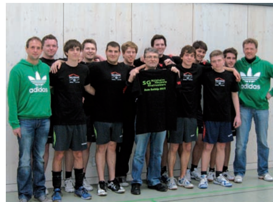
„Zweite Herrenmannschaft 1. Platz in der Bezirksliga“

Auch die zweite Mannschaft war sehr erfolgreich und konnte mit 26:2 Punkten souverän die Meisterschaft der Bezirksliga vor SG Speyer/Hassloch (18:10) gewinnen. In der Saison 2012/2013 tritt das Team in der Landesliga an.