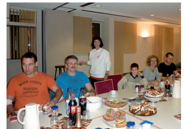
„Blutspende 2012“- Imbiss im Aufenthaltsraum

selbst gesundheitlich etwas Gutes tun. Ein Arzt überprüft Herz, Kreislauf und den augenblicklichen Gesundheitszustand. Außerdem wird anschließend das Blut im Labor verschiedenen Tests unterzogen. Wenn sich bei diesen Tests auffällige Werte ergeben, benachrichtigt der Blutspendedienst des Roten Kreuzes den Hausarzt des Spenders. Somit hat man als regelmäßiger Spender auch immer eine Kontrolle über seinen aktuellen Gesundheitszustand. Nach dem „Gesundheits-Check“, der Blutentnahme und einer kleinen Ruhepause werden die Spender gerne vom „Küchenteam“ des DRK-Ortsvereines empfangen. Mit einem liebevoll angerichteten Imbiss, sowie Kaffee und selbstgebackenem Kuchen verpflegt, bleiben viele Spender oft noch gerne bei einem Schwätzchen bei gemütlicher Atmosphäre sitzen.