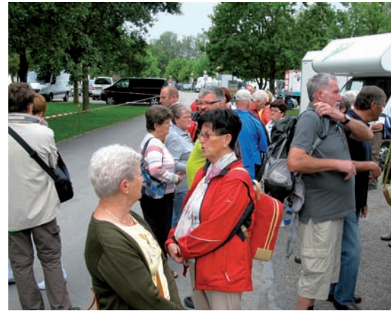
„Ankunft am Bodensee“

Unterkunft in der „Apfelblüte“, machen den Ausflug unvergesslich.