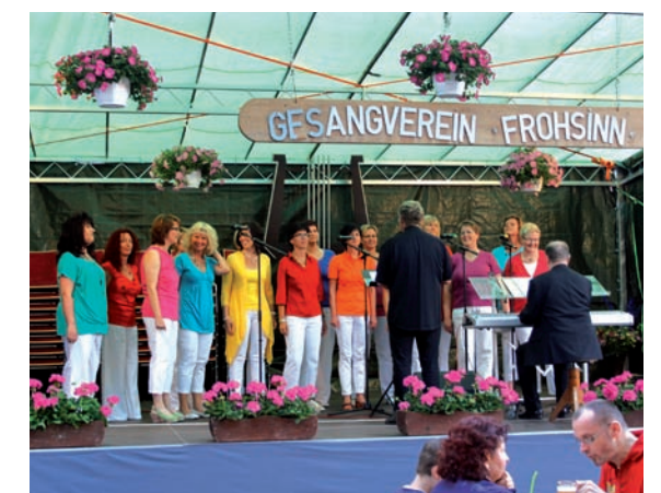
„Frauenchor Chorisma beim Auftritt am Storchenfest“

Das Jahr 2012 ging der Frauenchor etwas ruhiger an, nachdem das Jubiläumskonzert von 2011 alle Sängerinnen ziemlich gefordert hatte. Beim Storchenfest sorgten sie mit ihrem Beitrag für Stimmung und verbrachten einen geselligen Abend mit den geladenen modernen Chören.