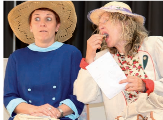
„Theaterspielerinnen bei der Szenenprobe“

Theaterspiel – herum spinnen – albern – querdenken – suchen – finden – improvisieren – entwickeln – tanzen – singen – festhalten – ausbauen – schreiben – proben – verwerfen – proben – begeistern – verdichten – proben – feilen – proben – organisieren – werben – proben – absprechen – proben – entgegenfeiern – Premiere – aufatmen – festigen – begeistern – verändern... die Entwicklung eines Theaterstückes in Steno.