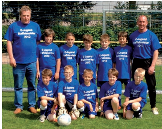
„E-Jugend – Meister Kreisklasse“

und Neupotz durch. Eine starke Leistung, die sich hoffentlich fortsetzen wird.