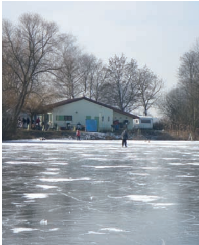
„Baggersee zugefroren Januar 2012“