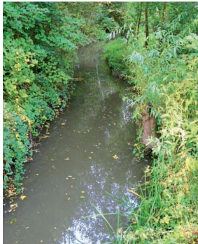
„Otterbachlauf“ – Oktober 2012