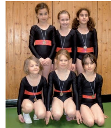
„Teilnehmerinnen des TSV am Bambini-Mehrkampf“