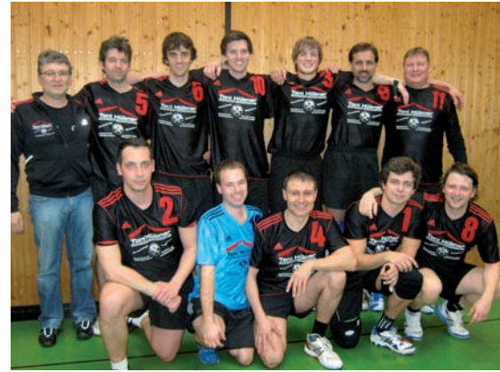
„Erste Herrenmannschaft 1. Platz in der Landesliga“

am Aufstieg beteiligt. Mit 20:4 Punkten wurde das Saisonziel „Aufstieg“ erreicht.