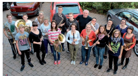
„Die aktuelle Neupotzter Jugendkapelle“

Das Jubiläumskonzert stand unter dem Motto „Juka meets junge Leute von früher und heute“ und wurde von den Aktiven der Seniorekapelle unterstützt. Musikalisch stimmungsvoll begrüßte das Orchester mit „Contrast“, einem Medley aus Spiritual- und Rock-Songs von Hans Kolditz. Sehr gefordert