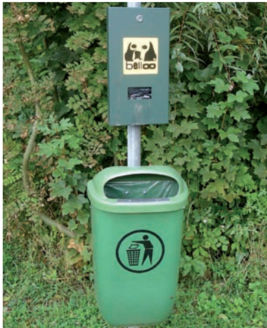
„Hundetoilette am Sportplatz“