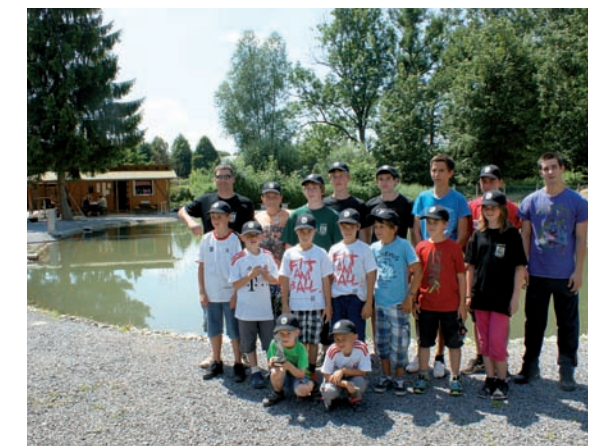
„Teilnehmer beim Forellenfischen“