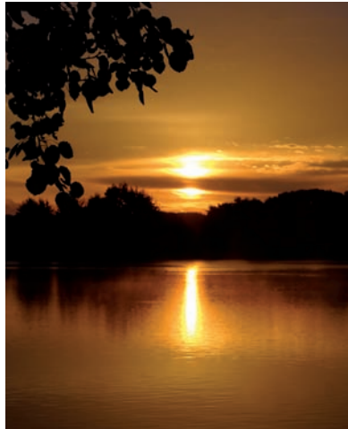
„Sonnenaufgang am Setzfeldsee“