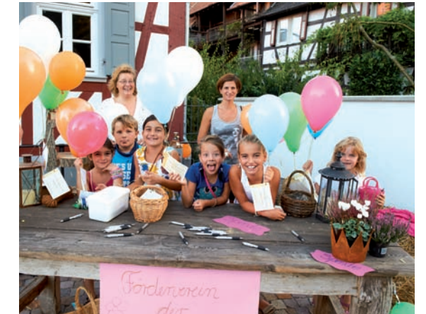
„Stand des Fördervereins bei der Nacht der Gastronomie“

individuell bedrucktes T-Shirt sowie Stifte und Süßigkeiten. Bei der Nacht der Gastronomie gab es einen Stand vor dem Haus „Leben am Strom“, wo Luftballons mit Gas gefüllt wurden und gegen eine kleine Spende durfte man eine Postkarte mit Adresse versehen und ihn starten.