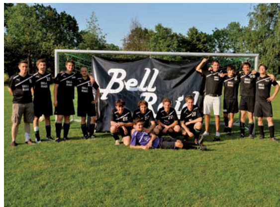
„Dorfmeister 2012 – BellRaid“

An Pfingsten lud der FCN zur Sportwoche ein. Donnerstag und Samstag spielten die örtlichen Vereine um den Titel des Neupotzer Fußball-Dorfmeisters. In packenden Spielen kämpften 10 Teams um den Sieg. Im Finale standen sich die Mannschaft des Tennisclub gegen BellRaid gegenüber. Nach einem Unentschieden kam es zum Elfmeterschießen, welches das Team von BellRaid für sich entscheiden konnte.