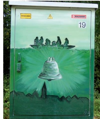
„Stromkasten bemalt von Sascha Braun“