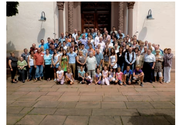
„Verwandte der Schindler-Familie vor der Kirche“