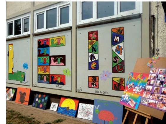
„Kunstwerke“ der Neupotzer Künstler