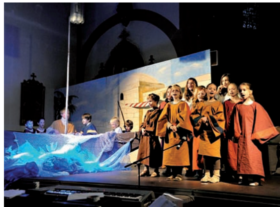
„Biblische Darstellung der Geschichte“

Der Kinderchor Erlfinken feierte im Jahr 2012 sein 35-jähriges Bestehen. Im Hinblick auf dieses Ereignis wurde bereits im Jahr 2011 das Musical „Petrus Superstar(k)“ einstudiert und an zwei Tagen eine Woche vor Weihnachten in der St. Bartholomäuskirche präsentiert. 34 Jungen und Mädchen im Alter von 5 bis 15 Jahren zeigten auf zwei Bühnen aktuelle Probleme Jugendlicher sowie die Geschichte um Jesus und Petrus. So ging es etwa um das Gefühl nicht im Mittelpunkt zu stehen. Auch Petrus erging es so und dennoch wurde er von Jesus angenommen und wertgeschätzt.