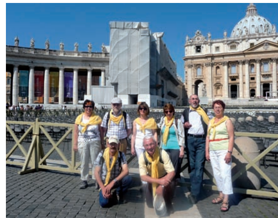
„Die Pilger der Pfarreiengemeinschaft“