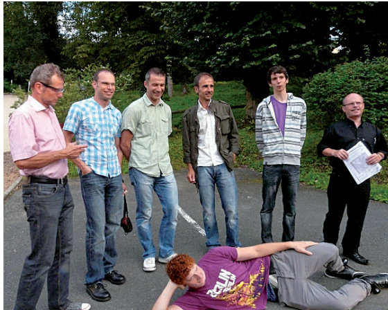
„Mannschaft nach der Siegerehrung beim Vin d'honneur in Bourbon Lancy“