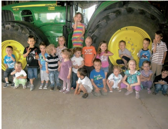
Schmiedhof – „Schmetterlingsgruppe“