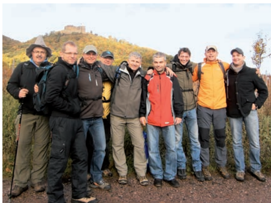
„Herren 40 bei der Mannschafts-Herbstwanderung“