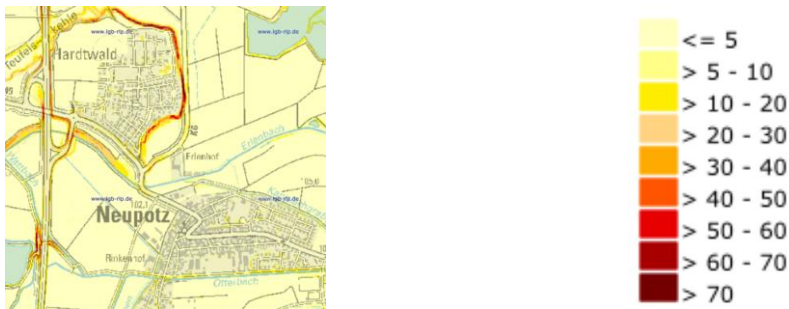
Abbildung 5: Hangneigung im Plangebiet

Das Plangebiet liegt im Bereich des nördlichen Oberrheintieflandes in der Untereinheit Mühlhofen-Rheinzaberner Riedel auf einer Höhe zwischen 110 ü. NN. Der Planungsraum ist Bestandteil zweier Bodengroßlandschaften. Im Süden des Gebietes befindet sich die Bodengroßlandschaft der Auen und Niederterrassen und nördlich die Bodengroßlandschaft der Hochflutlehm-, Terrassensand-, und Flussschottergebiete. Der Boden im Untersuchungsgebiet charakterisiert sich überwiegend durch lehmigen Sand. 2