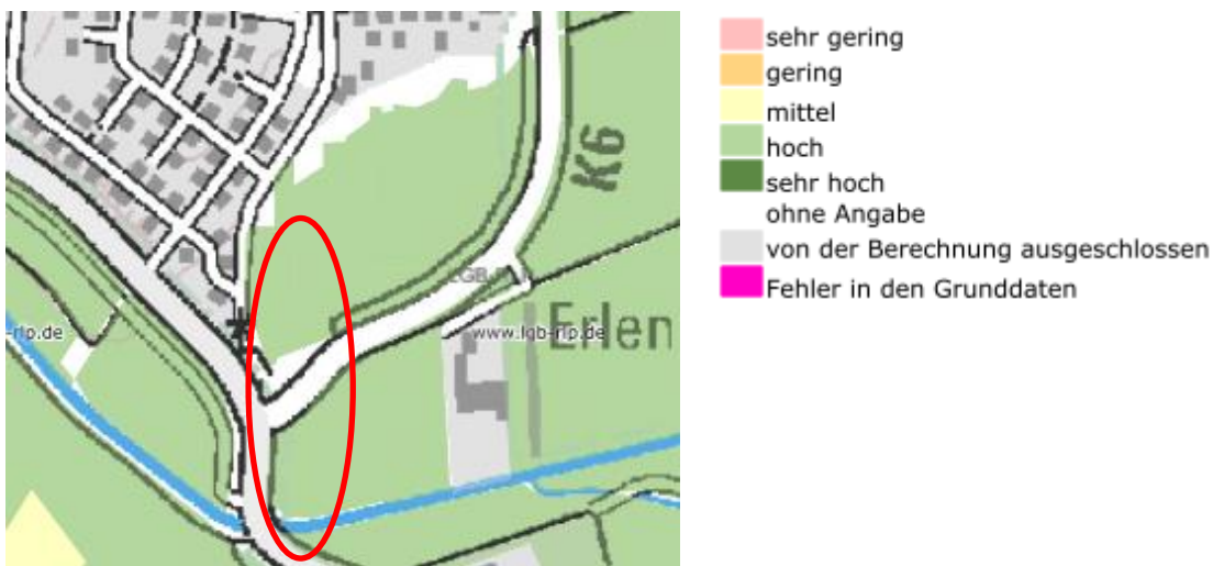
Abbildung 6: Bodenfunktionsbewertung, Quelle: Landesamt für Geologie und Bergbau, Kartenviewer, https://mapclient.lgb-rlp.de/