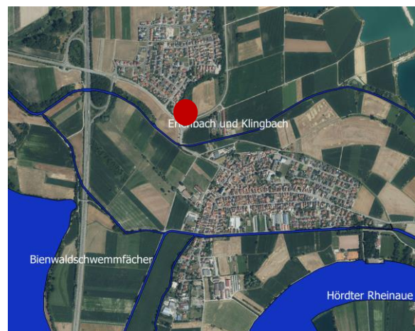
Abbildung 2: Lage von FFH Gebieten