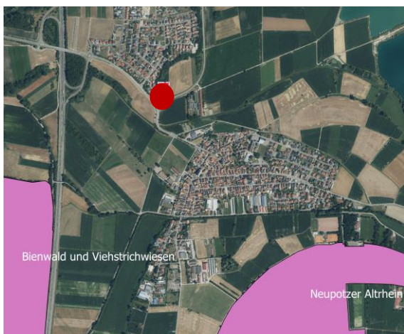
Abbildung 3: Lage des Plangebietes zu Vogelschutzgebieten