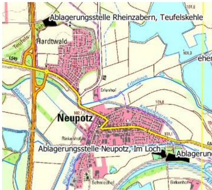
Abbildung 8: Altlasten in der Umgebung des Plangebiets (schwarz)