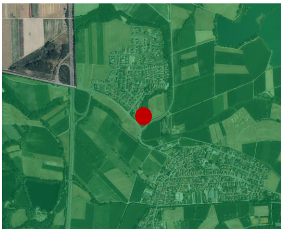
Abbildung 1: Lage des Plangebietes im Landschaftsschutzgebiet Pfälzische Rheinauen

In einer Entfernung von über 700 m befinden sich Vogelschutzgebiete. Diese werden aber räumlich durch die B 9 bzw. die Ortslage von Neupotz vom Plangebiet getrennt. Auch einzelne Biotope und Flächen des Biotopverbundes liegen nicht im Umkreis des Plangebietes. Hier sind vor allem die Bereiche des Erlenbachs zu nennen.